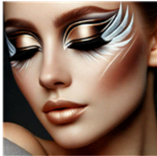
[그림 5] 아르테코 기반의 생성 인공지능(AI) DALL-E 2를 활용한 백조의 호수 '오테뜨'의 메이크업 디자인