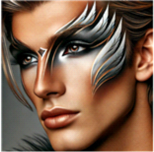
[그림 5] 아르테코 기반의 생성 인공지능(AI) DALL-E 2를 활용한 백조의 호수 '오테뜨'의 메이크업 디자인