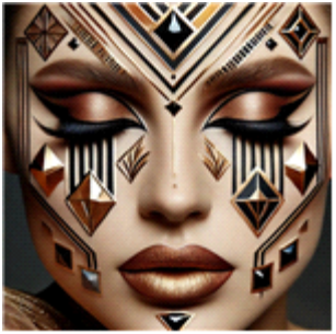
[그림 3] 아르누보 기반의 생성 인공지능(AI) DALL-E 2를 활용한 백조의 호수 '지그프리트'의 메이크업 디자인