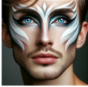
[그림 3] 아르누보 기반의 생성 인공지능(AI) DALL-E 2를 활용한 백조의 호수 '지그프리트'의 메이크업 디자인