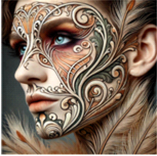
[그림 1] 아르누보 기반의 생성 인공지능(AI) DALL-E 2를 활용한 백조의 호수 '오테뜨'의 메이크업 디자인