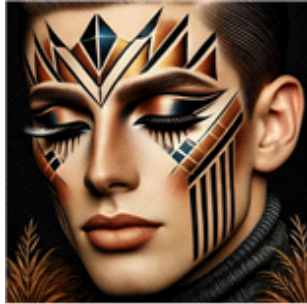
[그림 7] 아르테코 기반의 생성 인공지능(AI) DALL-E 2를 활용한 백조의 호수 '지그프리트'의 메이크업 디자인