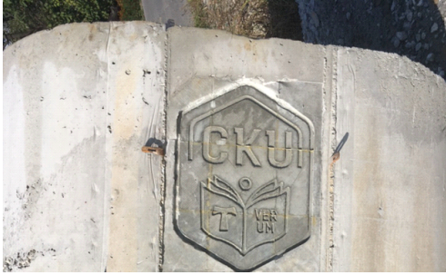
[그림 4] 콘크리트 기둥에 각인된 로고