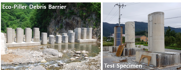
[그림 1] 실험용 시험체

3D 프린팅을 수행할 모델링의 대상으로 학생들의 실습을 위해 콘크리트 부재 중 산사태 예방을 위한 친환경 에코필라 사방댐을 선정하고, [그림 1]와 같이 성능실험용 시험체의 중공트랙형 기둥단면의 표면부에 대학교 로고를 상징적으로 연출하는 것을 목표로 설정하여, 상용 BIM도구를 이용한 문양 거푸집 모델링을 수행하였다.