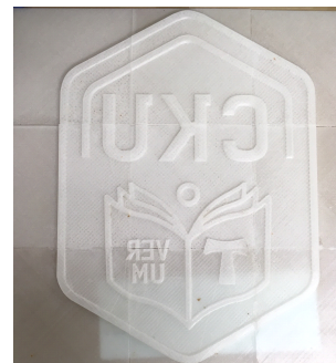
[그림 3] 3D 프린터로 제작한 폼라이너

BIM모델링 데이터를 기초로 시작품을 출력할 3D프린터는 FB-Z420모델이며 PLA, ABS, TPU등의 다양한 소재를 활용할 수 있는 전문가용으로 대학 내 3D프린팅 교육센터에 보급되어 있는 장비를 활용하였다.