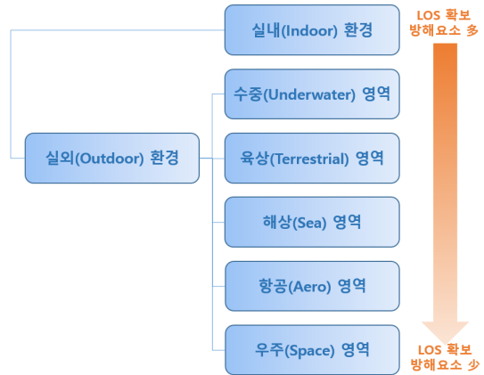
Fig. 2. Classification of Optical Wireless Communication Usage Environments

광무선 통신은 사용 환경에 따라서 실내(Indoor) 환경과 실외(Outdoor) 환경으로 분류할 수 있고, 실외 환경은 다시 수중(Underwater) 영역, 육상(Terrestrial) 영역, 해상(Sea) 영역, 항공(Aero) 영역, 우주(Space) 영역으로 세부 분류할 수 있다.