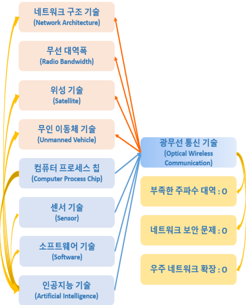
Fig. 4. Technology Relationship between NCW Implementation Technology and Optical Wireless Communication

상호 융합과 발전을 통해 네트워크 중심전의 기술이 진보할 것으로 사료된다. 기술의 상호관계에서 특정 기술들의 발전이 기반이 되어 전체 NCW 구현 성능을 향상할 수 있는지 과정을 파악할 수 있다.