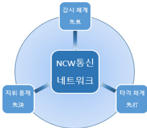
Fig. 3. Connectivity with each system in the NCW communication network

현대 군사 작전에서 네트워크 중심전은 점차 중요해지고 있다. 전장·감시 체계로 적의 동태를 먼저 파악하고, 지휘·통제 체계로 결정하여 정밀타격 체계로 적을 선제적으로 공격하여 섬멸하는 개념이다.