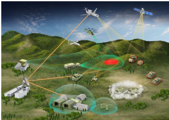
Fig. 1. Operational Concept for CBRN System

국내 화생방체계의 기술수준 분석을 위해 본연구에서는 국내 화생방분야 연구개발에서 다양한 경험과 관련 지식을 보유하고 있는 전문가 집단을 대상으로 델파이 설문기법을 활용하였다. 델파이 기법을 활용한 수준평가를 통해 전문가들의 의견을 종합적으로 반영하여 객관적이고 신뢰할 수 있는 결과를 얻을 수 있었다[3].