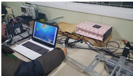
[그림 3] 시지각 운동협응 방식 상지재활로봇