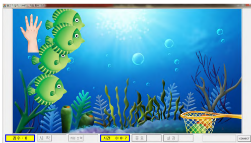
[그림 2] 상지재활 프로그램

기구 끝점의 힘 F는 주어지, 자코비안 행렬은 각 모터의 각도에 관한 함수이므로 이 각도를 얻음으로써 구할 수 있다.