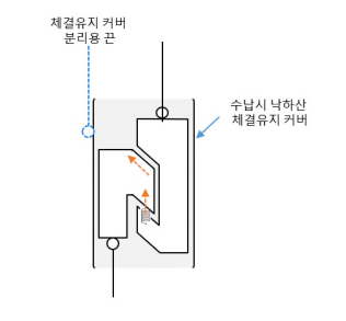
[그림 2] 낙하산 분리 장치 구조

그림 3은 위 그림의 낙하산 분리장치 구조를 3D 프린터를 통해 구현한 사진이다. 해당 장치를 활용하여 그림 4와 같이 낙하산을 통한 투하시험을 통해 착지 후 낙하산이 분리됨을 확인하였다.