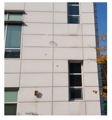
[그림 4] 투하 시험을 통한 낙하산 분리 장치 구조 테스트