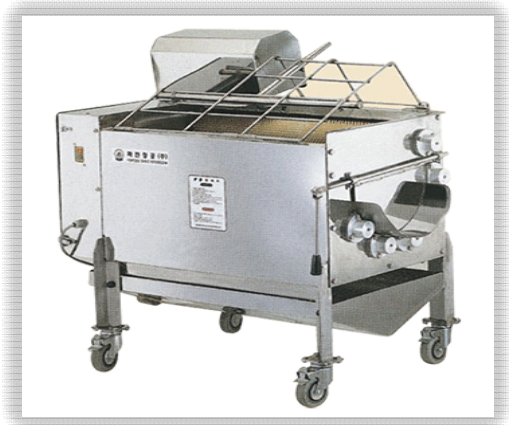
[그림 2] 바렐식 무 표피 탈피기

그림 2의 바렐식 무(Radish) 표피 탈피 기종은 현 시장에서 두 번째 점유율을 보유하고 있는 탈피기로서 대형 용기에 다량의 무(Radish)를 집적하고 강한 진동을 부여하여 가공물 상호 간의 마찰에 의해 표피가 탈피되는 방식(바렐식)을 활용한다.